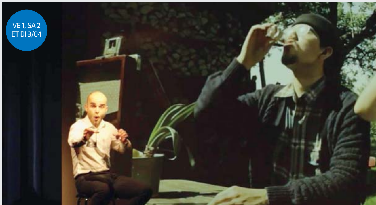
Un film, un acteur sur scène: le genre de mélanges qui sera à l'honneur ce week-end à Fontainemelon. SP